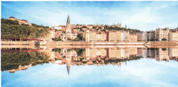
* Inklusivleistungen vom Reisebüro Hohenahr